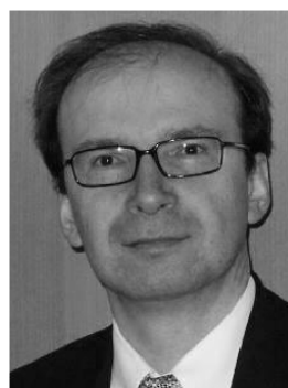
RVG Hans Oswald München